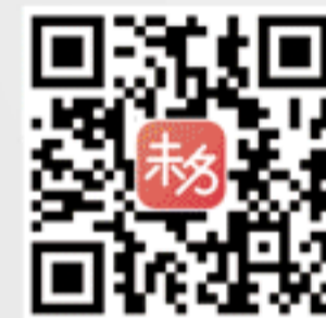
北大未名BBS官方微博