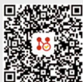
网关客户端 Android 版