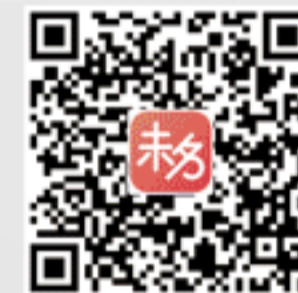
扫码下载北大未名BBS官方手机客户端