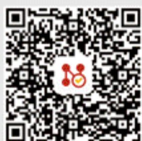
网关客户端 iOS 版